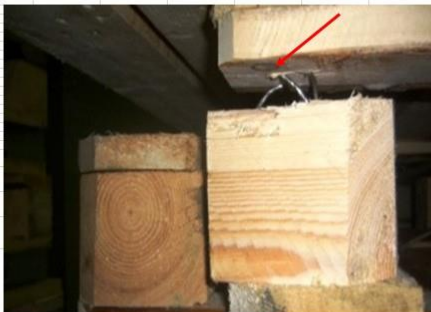
Сквозные зазоры между соприкасающимися поверхностями деталей

Критические несоответствия – недопустимо использование в производстве