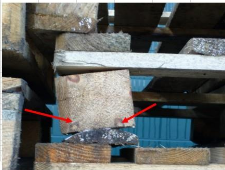
Двойной обзол досок нижнего (верхнего) настила

Критические несоответствия – недопустимо использование в производстве