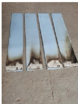
Рис. 1 Фото образцов после испытаний

Дополнительные наблюдения при испытании образца: оплавление, осаждение сажи.